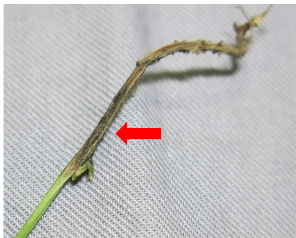
図2 厚膜胞子の形成による主茎地際部の黒変症状