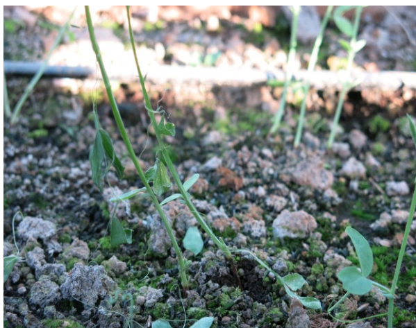
図1 地上部の萎凋症状